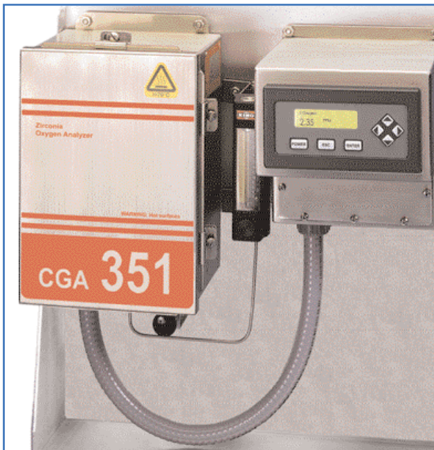
Standardversion des CGA 351